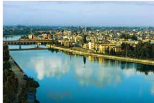
SEYHAN NEHRI - ADANA