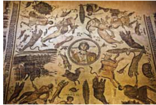
ARKEOLOJİ MÜZESİ - HATAY

TÜRKİYE'DE sağlıklı güvenilir üretimin en önemli destekçisi olan ve her zaman görev bilinciyle faaliyetlerini sürdüren Güneşli A.Ş. sponsorluğunda, geçtiğimiz ay Haziran ayında başlangıcını yaptığımız "Sektör Ziyaretleri" ile her ay farklı bir ili ve farklı bir bölgeyi ziyaret ettik; Türkiye yumurta sektörünün nabzını tuttuk.