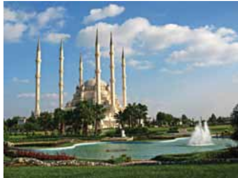
SABANCI MERKEZ CAMII - ADANA

KALİTELİ IRKLARDAN YÜKSEK RANDIMANLI VE SAĞLIKLI DAMIZLIK YETİŞTİRMEK İÇİN ÇABALAYAN HATAY VE ADANA'DAKİ ZİYARETLERİMİZDE BÖLGEYE HAS HASTALIKLARDAN VE SEKTÖREL ANLAMDA KARŞILAŞTIKLARI ZORLUKLARDAN KONUŞTUK.